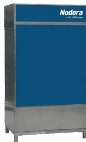
Störande lukter? Och begränsat utrymme?

Kombinationen kompakt design och högeffektiv luktreduktion ger nya möjligheter för projekterare och konsulter. Luktande frånluft kan renas och släppas ut i stängda garage och på innergårdar, vilket bidrar till billigare och mindre omfattande ventilationskanalsystem.