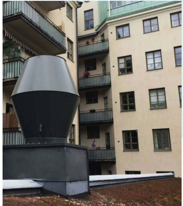
Luften från köket släpps ut mot en närliggande innergård och de boendes balkonger.

För att hantera luktproblemet kontaktade Stureplansgruppen Mellifig. Ett Ozonotech RENA Kitchen Solutions tillsammans med vårt katalytiska blandbäddsfiler Nodora var den perfekta lösningen. Först tar Ozonotech RENA-systemet kontinuerligt bort fett från köksfrånluften genom att injicera ozon i imkanalen. Den behandlade luften passerar sedan Nodora som renar luften och eliminerar lukt. Den varma, rena luften passerar sedan genom den kombinerade fläkten och värmeväxlaren. Tack vare Ozonotechs RENA-systemet och Nodora minimeras behovet av att underhålla och rengöra värmeväxlaren och fläkten manuellt. Slutligen släpps den reade frånluften ut. Nodora är ett modulsystem med extremt lågt tryckfall (dvs. låg energiförbrukning) med tanke på systemets höga kapacitet. Nodora har också en ovanligt hög reningskapacitet i förhållande till sin storlek – vilket är mycket fördelaktigt när reningskraven är höga men utrymmet begränsat.